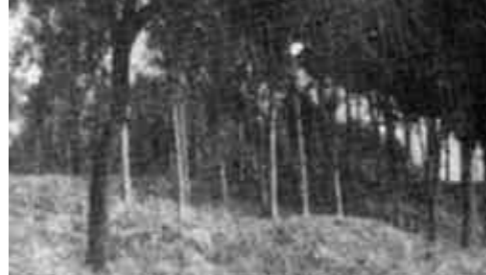
东营联合大学在发展中壮大

大通过深化内部管理改革，加快规模化建设，走出了具有东营联大特色的路子。一是坚持德育为首，全面贯彻党的教育方针；二是做到了管理上的封闭性与教学上的开放性的统一；三是坚持办学形式的灵活多样性；四是突出了专业设置的适应性和社会性；五是注重了人才培养的职业型、实用型。东营联大充分发挥联合办学、多位一体的系统功能优势，采取电视教育与面授教育并举，学历教育与非学历教育并存，脱产学习与在职培训相结合，形成了本、专科、中专教育兼顾的多形式、多层次的办学规模。联合大学力争几年内建成专业设置合理、设备设施配套、功能齐全、规模适当，与开发建设黄河三角洲跨世纪工程相适应的集普通高等教育、成人高等教育和高等职业技术教育于一体的综合性地方高校，为开发建设黄河三角洲的伟大事业培养更多的合格人才。（李广坤）